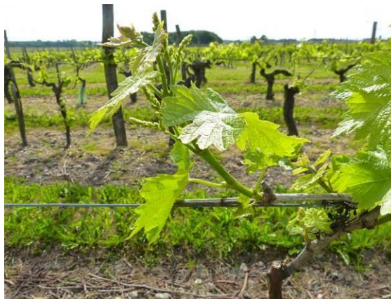
Stade 12 (5/6 feuilles étalées)

Les cépages précoces sont en moyenne au stade 09 (2/3 feuilles étalées).