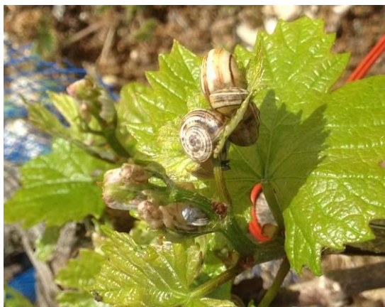
Escargots sur feuilles

On nous signale la présence de premiers symptômes d'érinose et d'eutypiose, de cochenilles et d'escargots dans les ceps. En parallèle, beaucoup d'auxiliaires sont observés (coccinelles, araignées...).