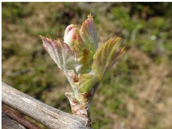
Stade 06 (éclatement du bourgeon)

Le débourrement s'est accéléré de manière spectaculaire en une semaine. Sur Ugni blanc, on observe des bourgeons atteignant le stade 12 (5/6 feuilles étalées, inflorescences visibles). En moyenne, il atteint le stade 06 (éclatement du bourgeon) sur tous les bourgeons observés et de 7 (première feuille étalée) si l'on tient compte uniquement des bourgeons débourrés. La vigne n'a plus qu'une semaine de retard par rapport à 2017.